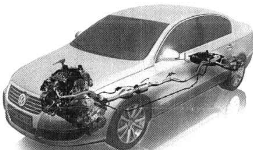
Rozmieszczenie elementów systemu redukującego tlenki azotu NOx w nadwoziu

Opisany sposób uzupełnienia wyposażenia samochodu pozwala na utrzymanie parametrów trakcyjno-eksploatacyjnych pojazdu (zużycie paliwa i moment obrotowy silnika) przy jednoczesnym spełnieniu norm dotyczących norm toksyczności spalin.